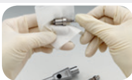
příp. dezinfekce otřením