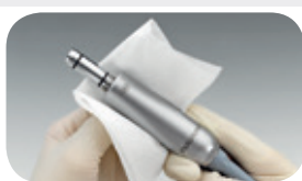
příp. dezinfekce otřením